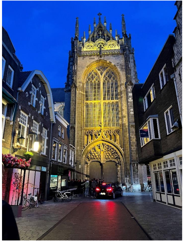
Ce soir, ce sera moules frites . Lekker (Excellent en néerlandais)!!